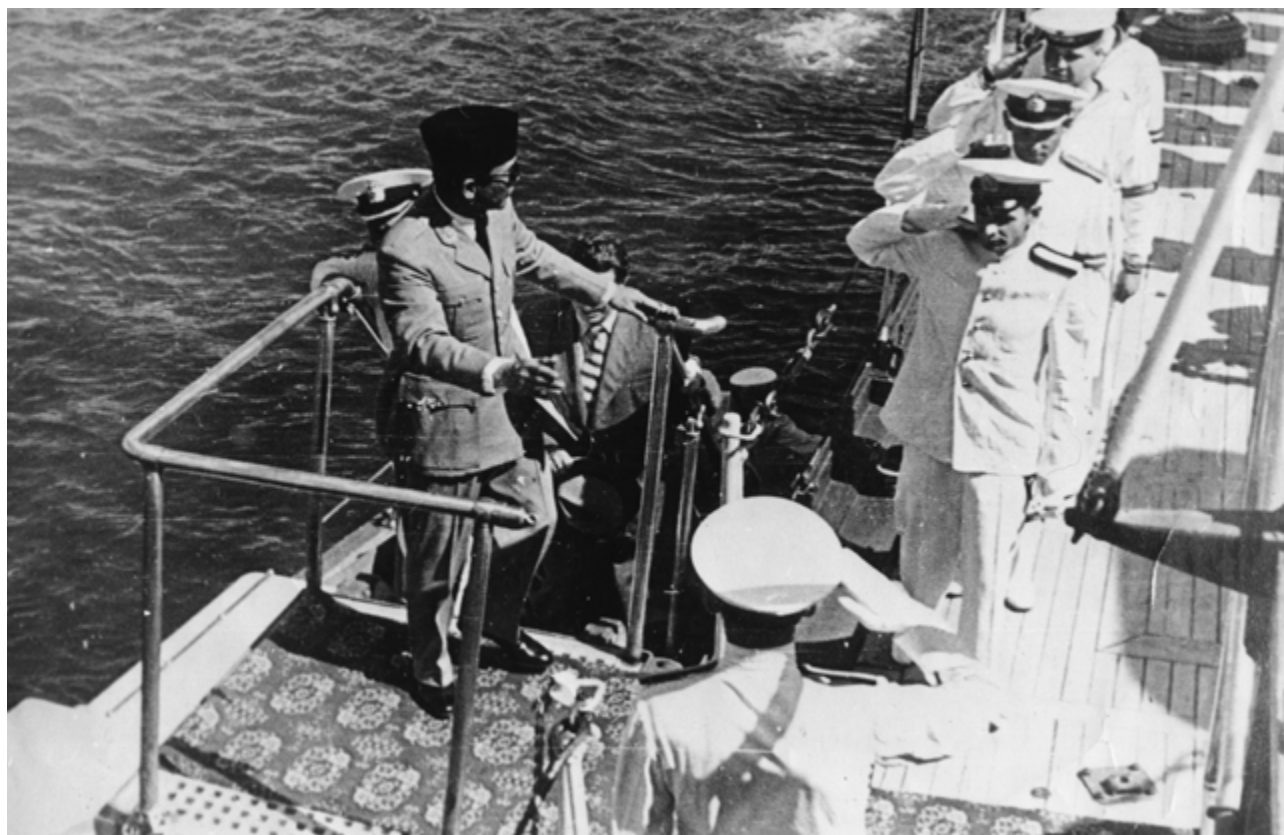
Встреча императора Эфиопии Хайле Силассие Ина борту крейсера «Михаил Кутузов»

Чести «Кутузова» в Новороссийске ничего не угрожает, разве что падает на него тень недоброй славы города как «могилы Черноморского флота». Именно так прозвали Новороссийск после того, как в 1918 году в Цемес-